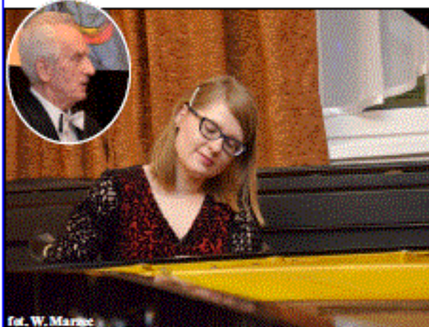
fol. W. Marzec